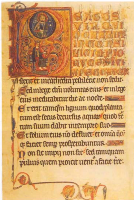
1. ábra Magyarországi psalterium (1255 és 1261 között)