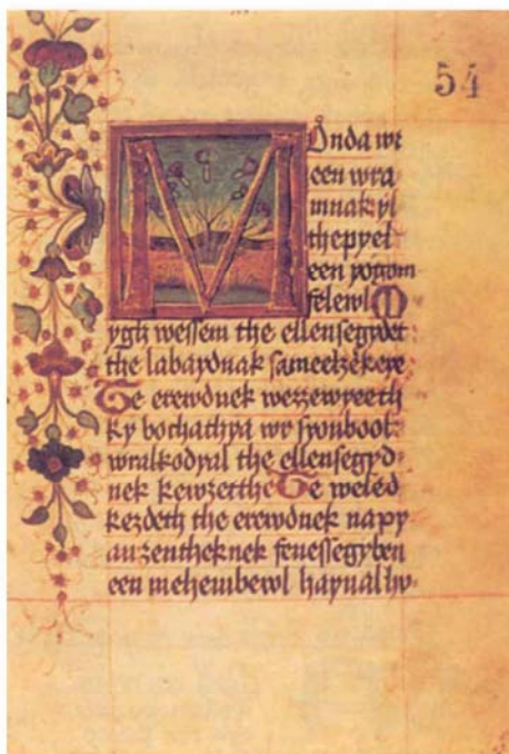
3. ábra Festetics-kódex (1493 k.)